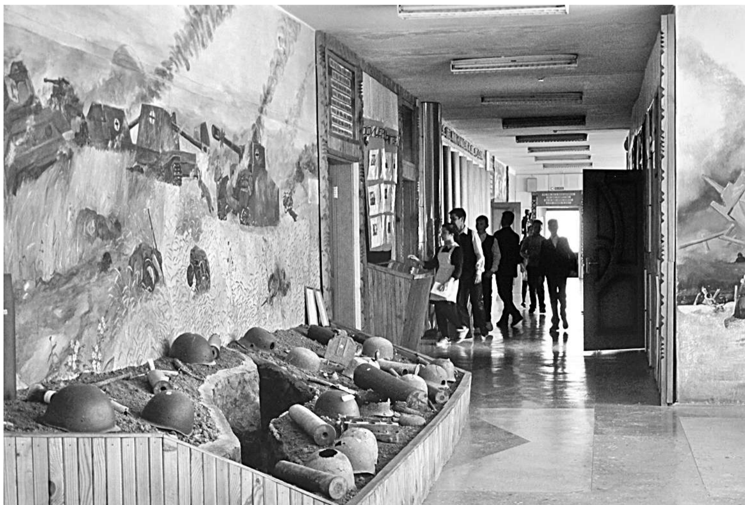
Школьный музей Великой Отчужденной войны