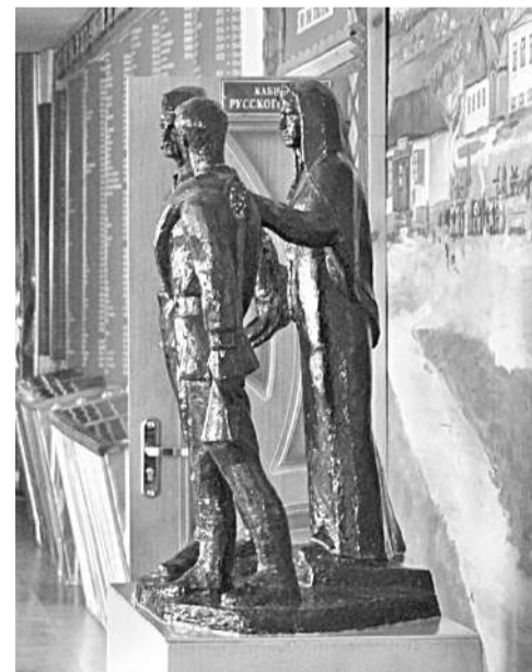
Школьный музей Великой Отечественной войны

Уверена в том, что в школе всегда ведущей и главной должна быть функция воспитания, ответственности за формирование человеческой личности. В детях необходимо формировать нравственные принципы, делая это незаметно и каждодневно. В нашей школе детей и педагогов связывают